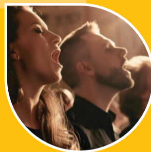
Körsång på torget