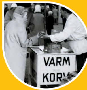
Korv och glögg utanför Fasaden