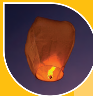
Rislyktor tänds och stiger mot skyn