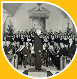
Musikkåren spelar i biosalongen, Fasaden