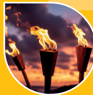
Fackeltåg till torget