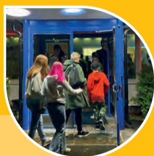
Firandet inleds vid Fasaden