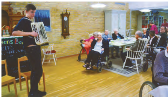
Publiken njuter av Jularbomusiken